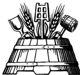
Zunftzeichen der Brauer